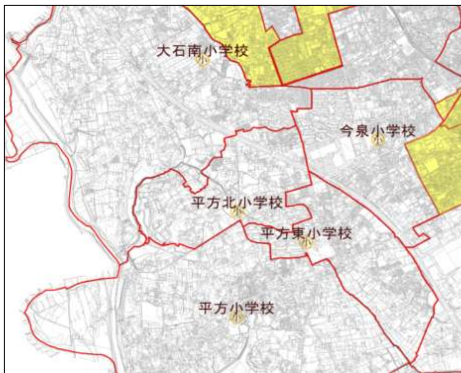
図 2 平方北小学校と近隣の学校の学区

図 2 は平方北小学校の近隣校の配置と通学区域図です。通学区域が隣接する学校は、大石南小学校、今泉小学校、平方東小学校、平方小学校の 4 校です。