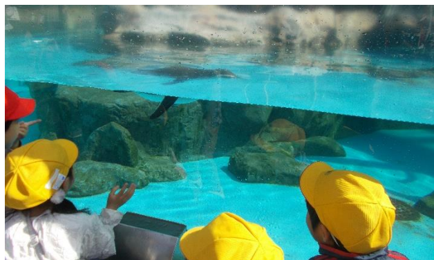
「わーっ、とんでいるみたい！」