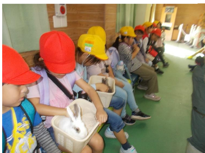
「ふわふわして、あたたかい！！」