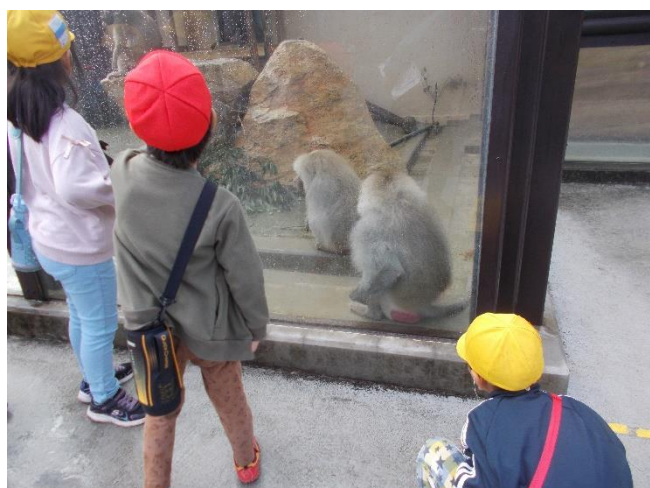
目の前にいるさるを、じーっと観察。