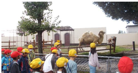
らくだの大きさにびっくり！！

生活科『いきものとなかよし』の単元の一環で、東武動物公園へ行きました。大型の動物から、小型の動物まで、それぞれが生命をもっていることに気付き、親しみをもって見学をしていました。