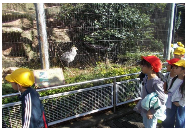
「何ていう鳥だろう？」