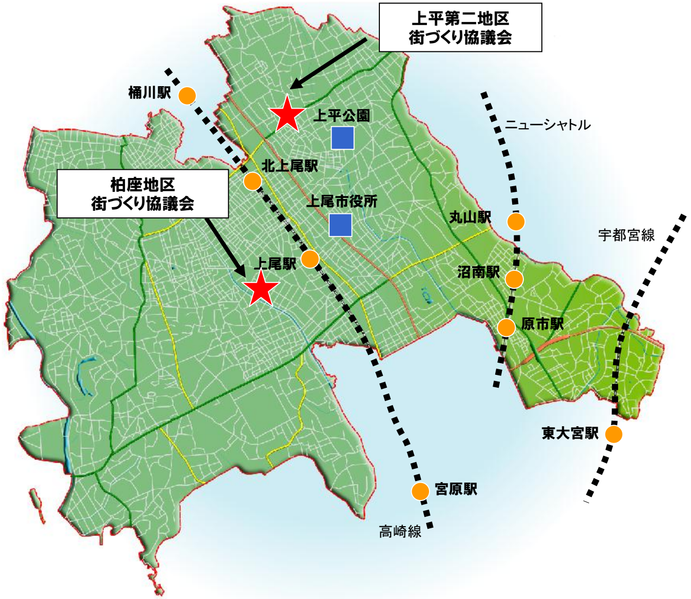
街づくり協議会位置図